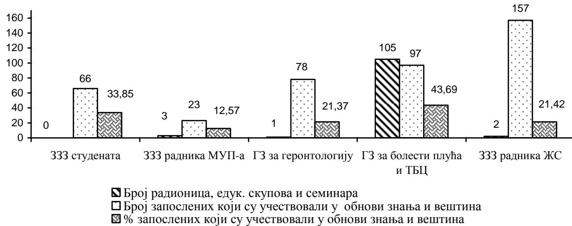
Табела 1. Стицање и обнова знања и вештина запослених

Графикон 2. Показатељи квалитета у области стицања и обнове знања и вештина запослених у заводима који обављају делатност на примарном нивоу