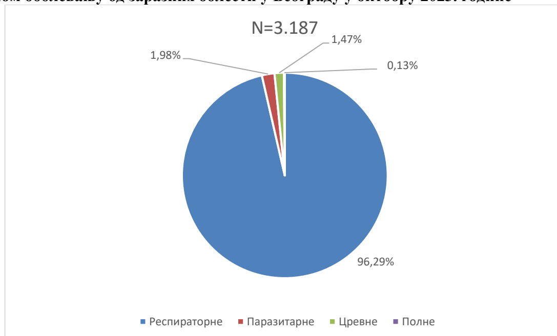
Графикон бр. 1. Процентуална заступљеност појединих група болести у укупном оболевању од заразних болести у Београду у октобру 2023. године

Заступљеност појединих група заразних болести у структури оболевања од свих заразних болести у Београду регистрованих током октобра приказана је на графикону бр. 1.