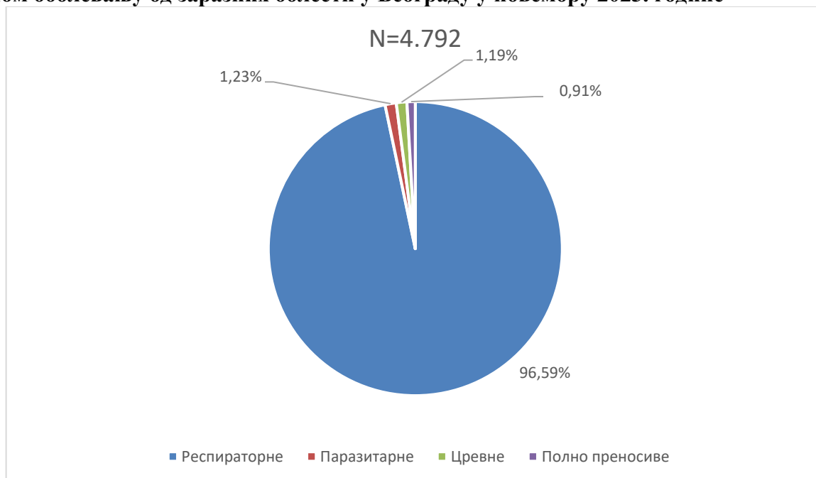
Графикон бр. 1. Процентуална заступљеност појединих група болести у укупном оболевању од заразних болести у Београду у новембру 2023. године

Заступљеност појединих група заразних болести у структури оболевања од свих заразних болести у Београду регистрованих током новембра приказана је на графикону бр. 1.