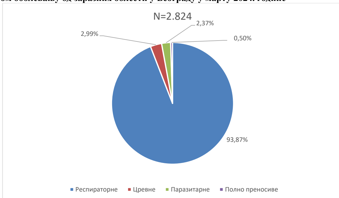
Графикон бр. 1. Процентуална заступљеност појединих група болести у укупном оболевању од заразних болести у Београду у марту 2024. године

Заступљеност појединих група заразних болести у структури оболевања од свих заразних болести у Београду регистрованих током марта приказана је на графикону бр. 1.