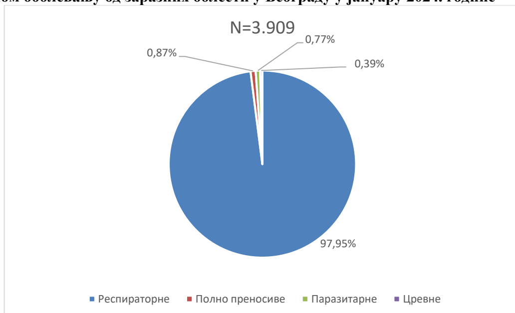
Графикон бр. 1. Процентуална заступљеност појединих група болести у укупном оболевању од заразних болести у Београду у јануару 2024. године

Заступљеност појединих група заразних болести у структури оболевања од свих заразних болести у Београду регистрованих током јануара приказана је на графикону бр. 1.