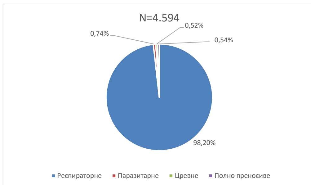
Графикон бр. 1. Процентуална заступљеност појединих група болести у укупном оболевању од заразних болести у Београду у децембру 2023. године

Заступљеност појединих група заразних болести у структури оболевања од свих заразних болести у Београду регистрованих током децембра приказана је на графикону бр. 1.