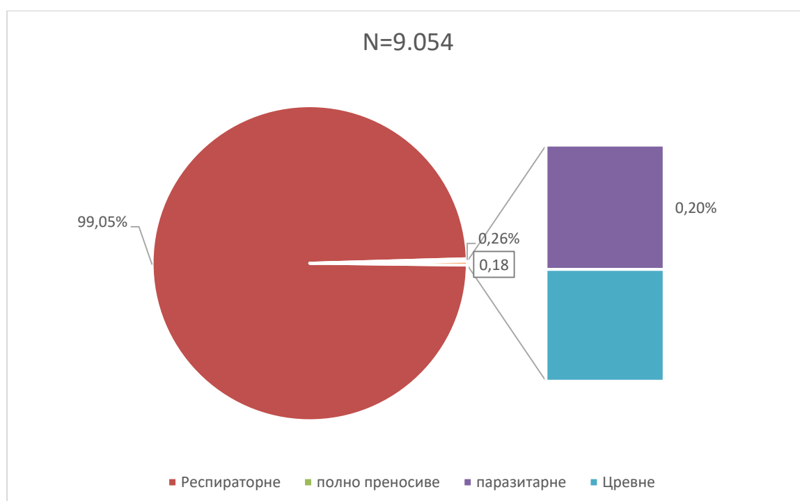
Графикон бр. 1. Процентуална заступљеност појединих група болести у укупном оболевању од заразних болести у Београду у јулу 2022. године

Заступљеност појединих група заразних болести у структури оболевања од свих заразних болести у Београду регистрованих током јула приказана је на графикону бр. 1.