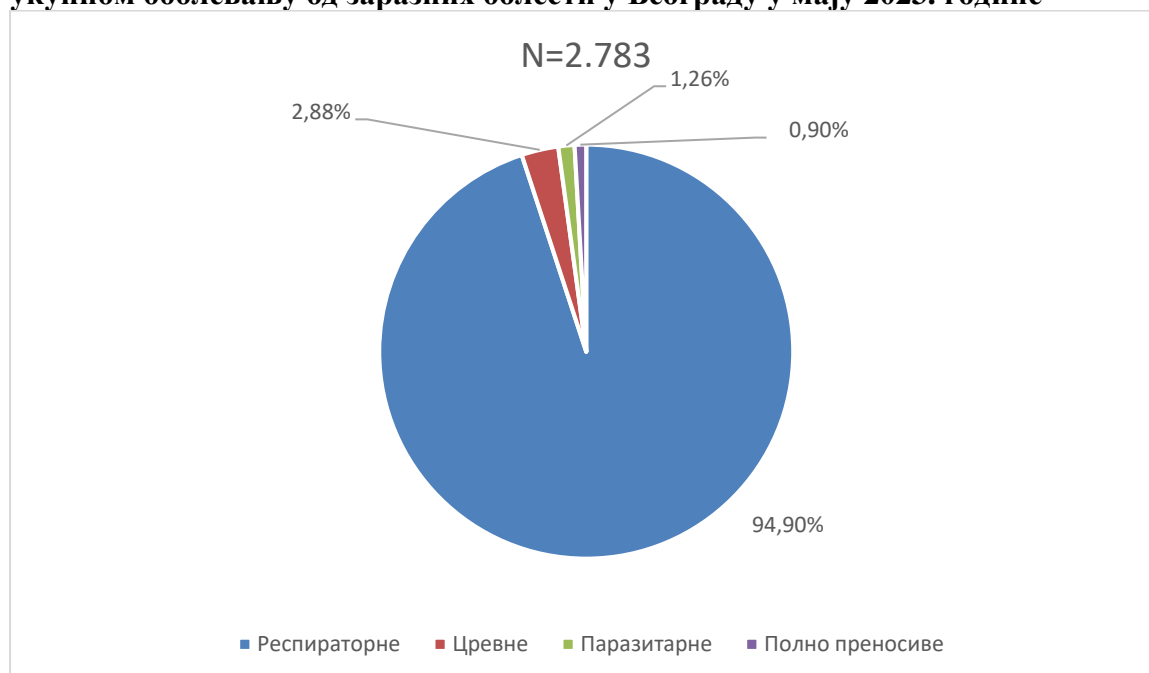
Графикон бр. 1. Процентуална заступљеност појединих група болести у укупном оболевању од заразних болести у Београду у мају 2023. године

Заступљеност појединих група заразних болести у структури оболевања од свих заразних болести у Београду регистрованих током маја приказана је на графикону бр. 1.