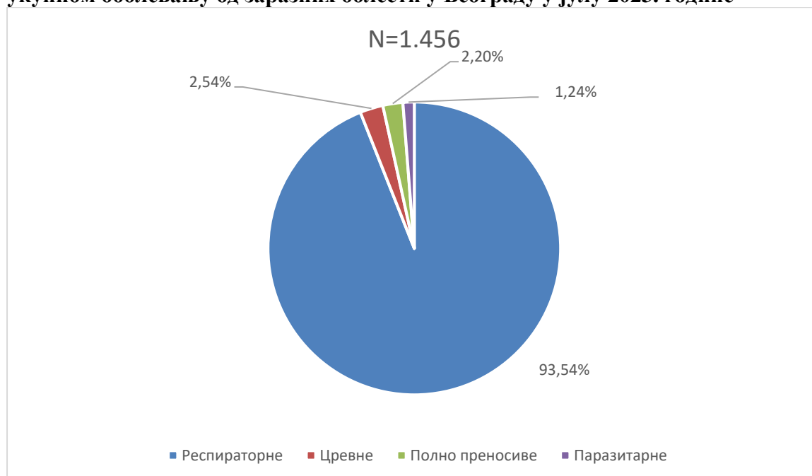
Графикон бр. 1. Процентуална заступљеност појединих група болести у укупном оболевању од заразних болести у Београду у јулу 2023. године

Заступљеност појединих група заразних болести у структури оболевања од свих заразних болести у Београду регистрованих током јула приказана је на графикону бр. 1.