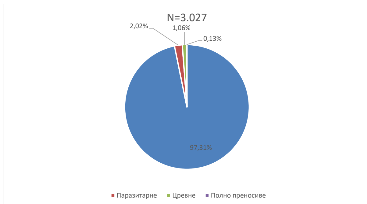
Графикон бр. 1. Процентуална заступљеност појединих група болести у укупном оболевању од заразних болести у Београду у фебруару 2023. године

Заступљеност појединих група заразних болести у структури оболевања од свих заразних болести у Београду регистрованих током фебруара приказана је на графикону бр. 1.