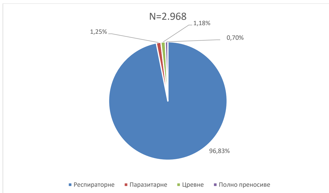
Графикон бр. 1. Процентуална заступљеност појединих група болести у укупном оболевању од заразних болести у Београду у априлу 2023. године

Заступљеност појединих група заразних болести у структури оболевања од свих заразних болести у Београду регистрованих током априла приказана је на графикону бр. 1.