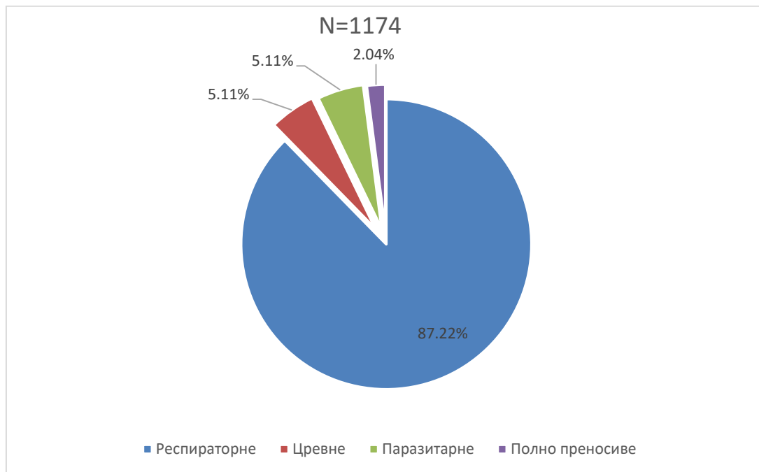
Графикон бр. 1. Процентуална заступљеност појединих група болести у укупном оболевању од заразних болести у Београду у јуну 2019. године

Међу регистрованим случајевима заразних болести током јуна доминирали су случајеви оболевања од: Varicella (662), Tonsilitis streptococcica (160), Pharyngitis streptococcica (111), Scabies (60), Pneumoniae (45) и Scarlatina (32).