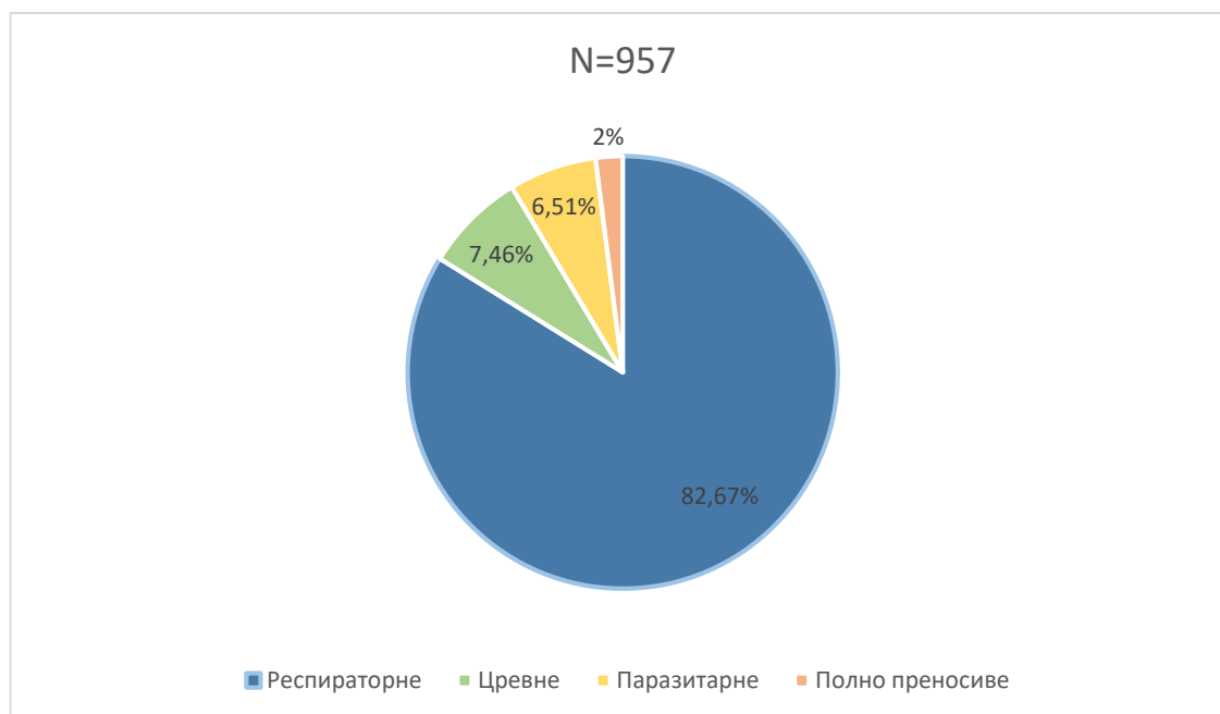
Графикон бр. 1. Процентуална заступљеност појединих група болести у укупном оболевању од заразних болести у Београду у јулу 2017. године

Учесталост најчешће регистрованих заразних болести у јулу приказана је на графикону бр. 1.